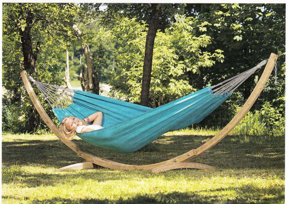
Hängematten gibt es in unzähligen Größen und Farben. Amazonas bietet dabei von Größe XXXL (Familienhängematten) bis zur Größe S (Kinderhängematten) alles an.

Für Hang Solo gibt es von Amazonas auch freistehende Gestelle aus Holz oder Metall. Sie sind flexibel einsetzbar und können nahezu überall aufgestellt werden – in Innenräumen ebenso wie draußen.