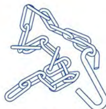
D - 1x