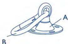
A.B - 1x